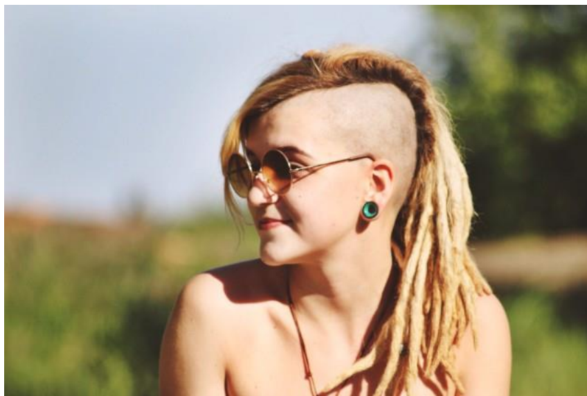
Kunnen jezelf zijn